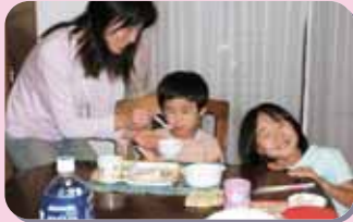
協会員宅での預かり