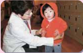
保育施設への迎え