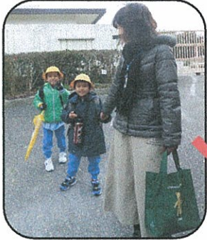
途中までお友達と一緒に♪

お預かりを依頼した当初は、不安や心配もありましたが、協力会員さんが『子育ての経験者』『地域に住む方』であることで、親子とも新たな地域との繋がりができました。温かく受け入れてくださったふぁみさぽさんに心から感謝しています。