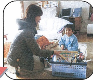
この日は協力会員の息子さんのおもちゃで遊び、ぬりえをしたり、寒い日だったけど外でサッカーもして遊びました。