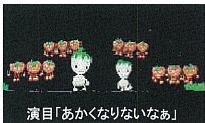
演目「あかくなりないなあ」

少し冷たい風が吹くものの、日差しは明るく、春がもうすぐそこに来ているのが感じられるなか、親子92名、協力会員12名とたいへん多くの会員の方が参加されました。