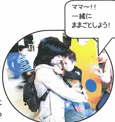
ママ~!! 一緒に ままごしよう!