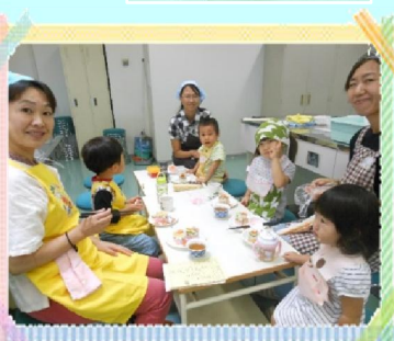
電子レンジを用いて安心して楽しいクッキングでした。