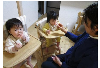
おやつとミルクでごきげんでした♡