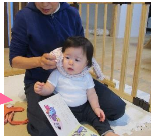
さあ、お風呂に入ろうね♡

ひとりずつお風呂に入るのを手伝います。浴室にて子どもをお母さんより受け取って着替えます。