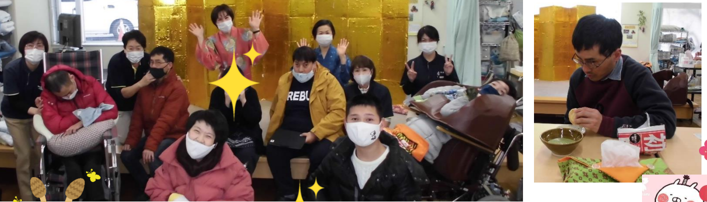
お抹茶で和みましたね~ 皆様の笑顔がいっぱいです。