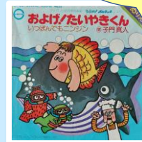
▲大流行したレコード