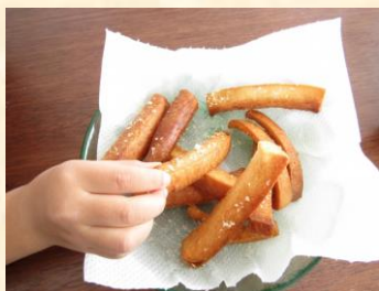
昭和のおやつといえば・・・ 「食パンの耳のあげパン」

私の昭和の時代の遊びは物はなくても皆が集まったら、自然発生的に遊びが始まりました。学校から帰ると近くの神社に行き、競争で先ずは狛犬の石によじ登り狛犬さんにまたがったりと自由でやんちゃな時代でした。