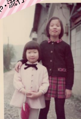
昭和40年代はミニスカートが大流行。お母さんが切ってくれた髪は、前髪がまっすぐの「おかつば頭」でした。