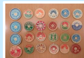
▲牛乳瓶のふたを集めて「ポッコン」という遊びをしたものです。