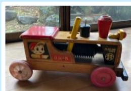
▲思い出深い木のおもちゃ