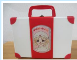
▲大人気少女漫画のグッズ

失敗しても大丈夫。どうするかを考えよう。柔軟な思考と判断力を養うのが今の教育のようです。