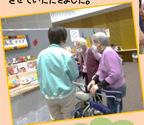
すごく上手に作ってるね～