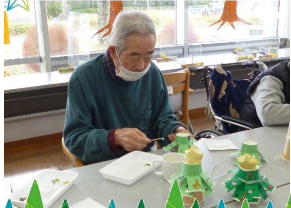
どこに貼ろうかな