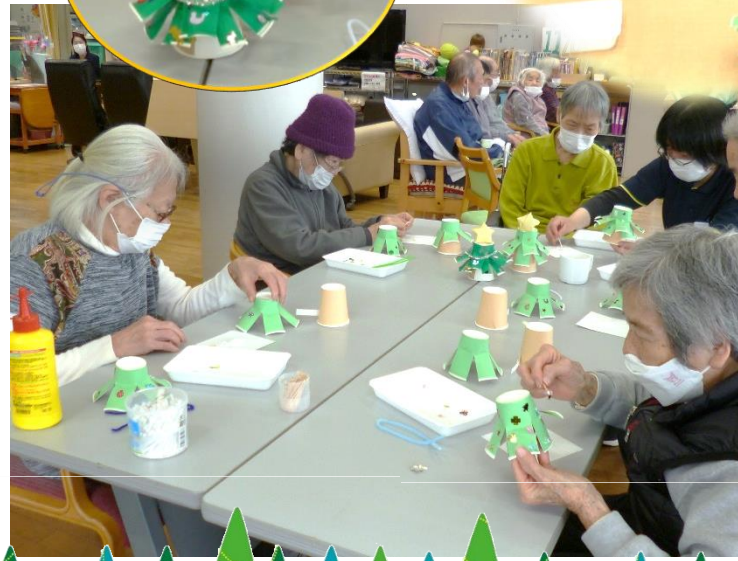
細かい部分も、皆さん根気よく作業されていました！