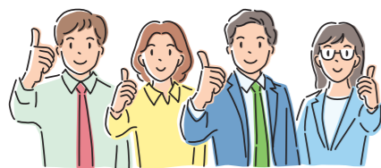
さんだ♥ささえあいねつとの発行▲

生きづらさを感じている方が暮らしを豊かにする情報を手に入れることができるよう情報発信を行います。