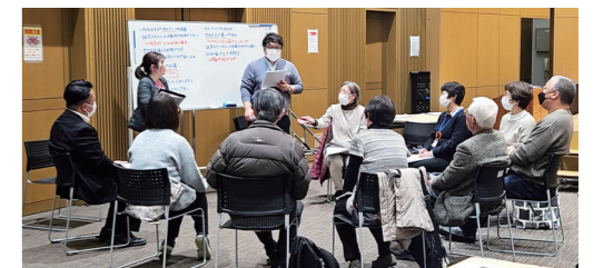
▲計画進捗・推進のための地域福祉協働推進ネットワーク グループディスカッションの様子