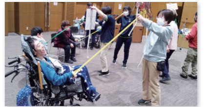
▲中央デイサービスセンター 身体障害者デイサービス レクリエーションの様子

既存の対象や分野によるつながりや方法に限らず、多様な力が柔軟につながることで、地域福祉推進のさらなる活性化を進めます。